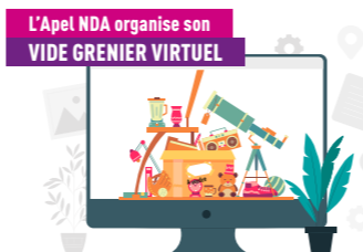
L'Apel NDA organise son VIDE GRENIER VIRTUEL

Et l'APEL fera des animations régulières afin que les parents de l'école puissent continuer à faire de bonnes affaires tout au long de l'année. Notre goûter n'est que partie remise !