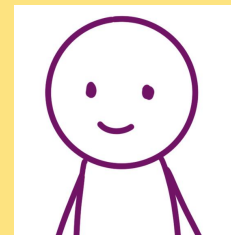
Учитель английского языка Госпожа ЭВАНС